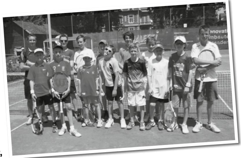
Impressionen zum Sommerlager, zu Gruppenbildern und einzelnen Trainingsgruppen...